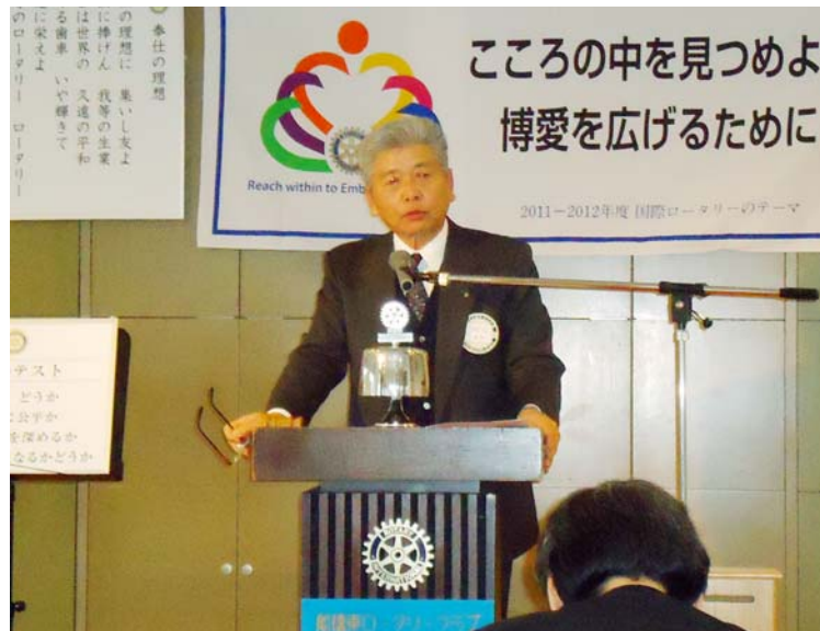
卓話する岩浅会員